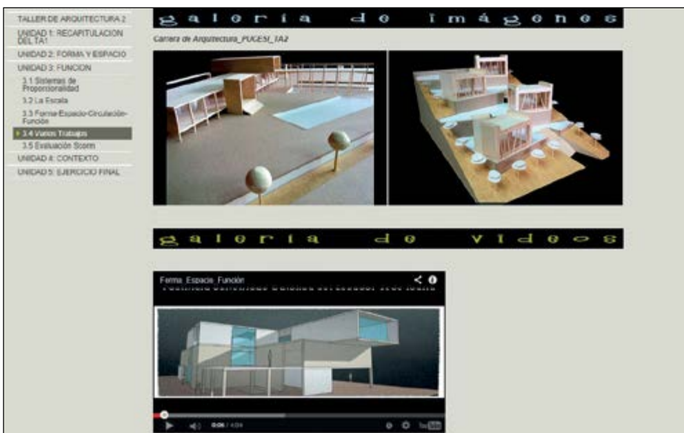
Gráfico 3 Propuesta de análisis, crítica e innovación

Análisis y crítica (innovación). Los talleres, por su nivel de complejidad, requieren que se potencien las habilidades y destrezas para resolver problemas y utilizar conceptos, instrumentos y recursos técnicos, permitiendo que su aprendizaje sea reflexivo y crítico (Méndez, 2012). El proceso se inicia capacitando al estudiante en la utilización del diseño asistido por computadora (CAD), para, posteriormente, pasar a dibujos más avanzados, permitiendo lograr una adecuada representación técnica arquitectónica para aplicar estos conocimientos en un proyecto y, finalmente, se capacita al estudiante en el modelado tridimensional, aplicación de materiales, ambientación, foto realismo, con el fin de realizar recorridos virtuales. Los avances virtuales en el uso de la arquitectura multimedia surgen de la necesidad de contar con elementos más interactivos y que dejen menos a la imaginación (Shanty, E., 2011). Para ello se utiliza videos: Flash, Sketchup, Lumion, logrando animaciones, complementando y situando el proyecto en entornos reales, planos en tres dimensiones que generan un mayor impacto visual y mejor percepción general de la distribución de una vivienda realizado con infografía 3D por computadora, optimizando el tiempo de explicación del proyecto para luego subir al internet.