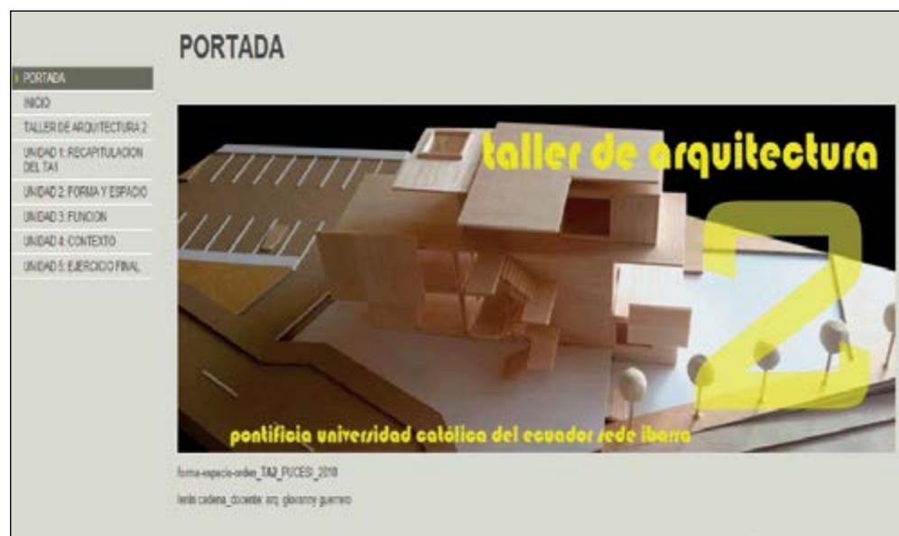
Gráfico 1 Propuesta de introducción

Introducción. Se describe el alcance de los contenidos del capítulo, dando una breve explicación o resumen del mismo, que permite tener una idea del contenido. Se realiza a través del sitio web Youtube, que permite compartir videos de contenidos académicos e informativos. Se plantea que los estudiantes del Taller evidencien elementos del lenguaje arquitectónico, realizando composiciones tridimensionales formales, espaciales y estructurales, utilizando material audiovisual con ayuda de programas de autor como Camtasia, Movie Maker, Cyberlink, entre otros, que les permitan crear videos y video tutoriales, para ser exportados al internet y luego al libro digital, para su presentación bajo la supervisión del docente, iniciándole en la interacción estudiante-computador-docente.