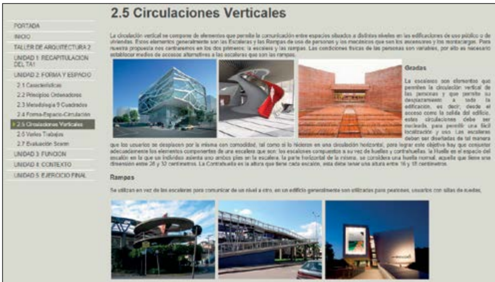
Gráfico 2 Propuesta de contenidos

Análisis y crítica (innovación). Los talleres, por su nivel de complejidad, requieren que se potencien las habilidades y destrezas para resolver problemas y utilizar conceptos, instrumentos y recursos técnicos, permitiendo que su aprendizaje sea reflexivo y crítico (Méndez, 2012). El proceso se inicia capacitando al estudiante en la utilización del diseño asistido por computadora (CAD), para, posteriormente, pasar a dibujos más avanzados, permitiendo lograr una adecuada representación técnica arquitectónica para aplicar estos conocimientos en un proyecto y, finalmente, se capacita al estudiante en el modelado tridimensional, aplicación de materiales, ambientación, foto realismo, con el fin de realizar recorridos virtuales. Los avances virtuales en el uso de la arquitectura multimedia surgen de la necesidad de contar con elementos más interactivos y que dejen menos a la imaginación (Shanty, E., 2011). Para ello se utiliza videos: Flash, Sketchup, Lumion, logrando animaciones, complementando y situando el proyecto en entornos reales, planos en tres dimensiones que generan un mayor impacto visual y mejor percepción general de la distribución de una vivienda realizado con infografía 3D por computadora, optimizando el tiempo de explicación del proyecto para luego subir al internet.