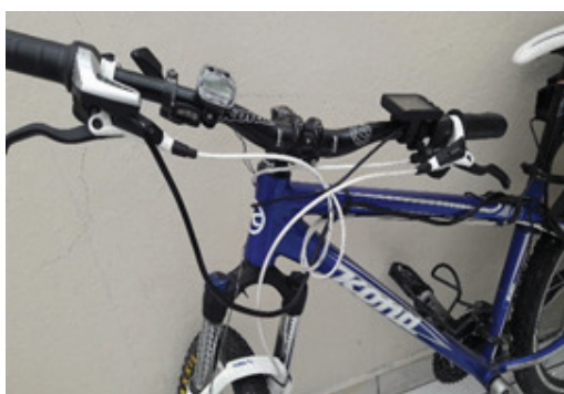
Figura 4. Articulación blanco del manillar

En el blanco del manillar se ajustan los manubrios de mando de aceleración tipo mariposa y se adapta el panel LCD que visualiza el estado de carga de la batería, velocidad y distancia recorrida.