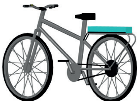
Figura 1. Prototipo bicicleta eléctrica

El prototipo de bicicleta eléctrica se construye con base a una bicicleta montañera convencional de tracción trasera aro 26" y marco estándar, a la cual se le equipan componentes eléctricos integrados por la batería (banco de baterías Ion-Litio recicladas -menos contaminantes que la de Plomo/Ácido-), controlador, motor y sensores para la asistencia de pedaleo y aceleración.