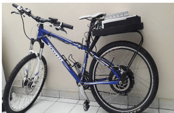
Figura 5. Vista lateral bicicleta eléctrica