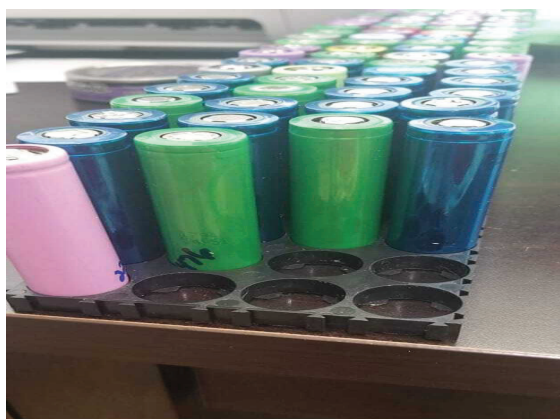
Figura 6. Conformación Banco de Baterías