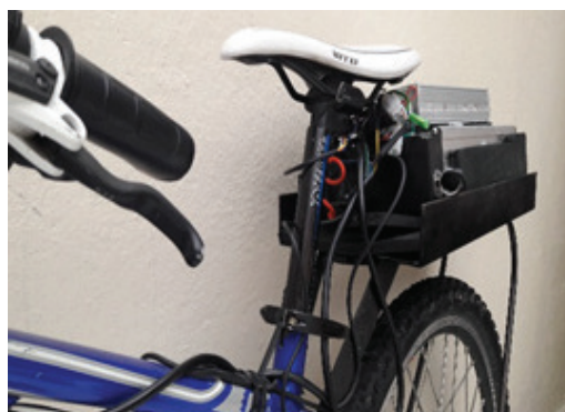
Figura 3. Ensamble controlador y batería

El sistema contempla un sistema de frenado dinámico que conserva parte de la energía perdida al frenar y la almacena en el banco de baterías para posterior liberación.