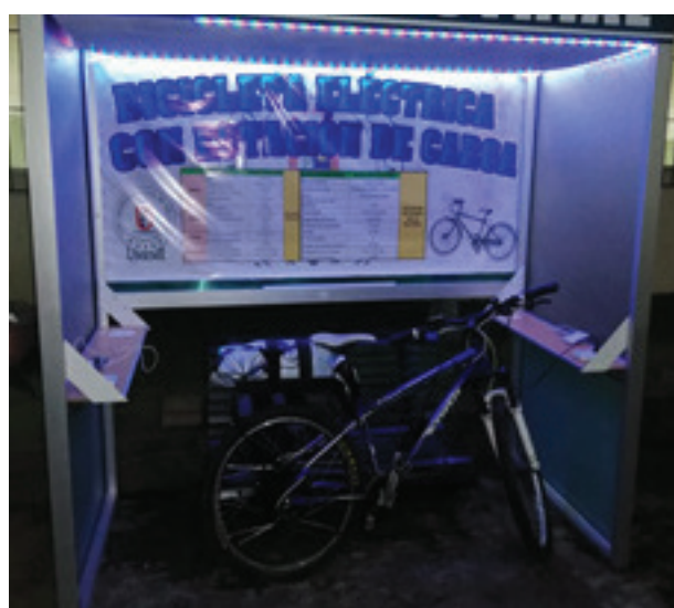
Figura 8. Estructura Estación de carga

La estación cuenta una estructura de aluminio tipo marco, para el montaje de equipos y componentes que soporta temporalidad y da confort y sombra.