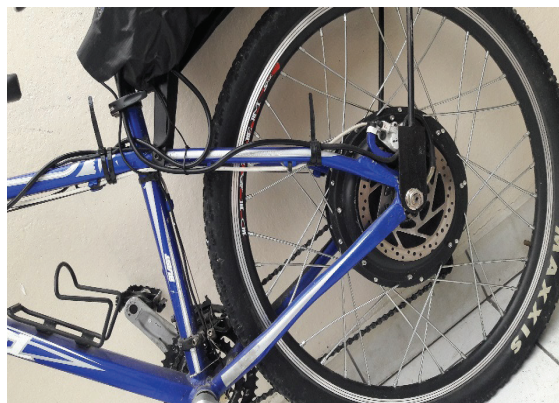
Figura 2. Ensamble de motor en rueda posterior

El ensamble del motor se realiza en la rueda posterior de la bicicleta adaptando un motor HUB sin escobillas de imanes permanentes, de 1500 Watts de potencia, en un solo armazón; se adaptan los ejes rotativos con pivote de torque para, en su conjunto, formar la rueda eléctrica motorizada con control de manubrio y pedaleo.