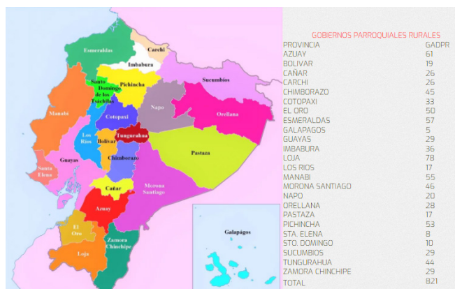
Figura 2. Gobiernos parroquiales rurales

En el Ecuador existen 821 Gobiernos parroquiales rurales, de conformidad con lo que establece el Consejo Nacional de Gobiernos Parroquiales Rurales del Ecuador.